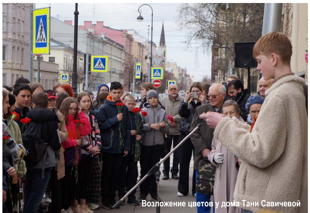
Возложение цветов у дома Тани Савичевой