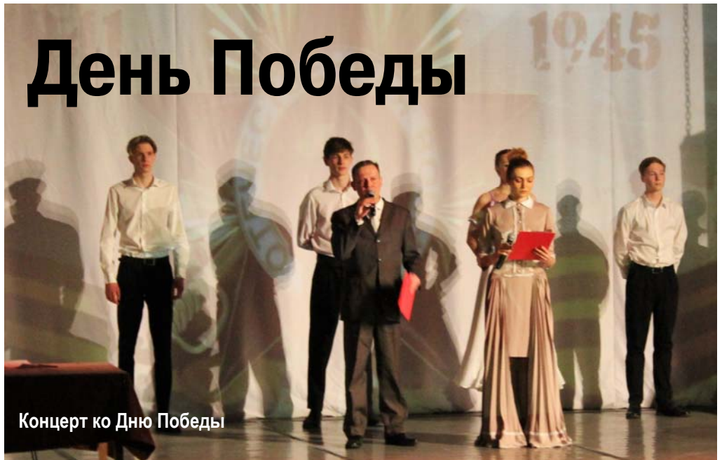
Концерт ко Дню Победы